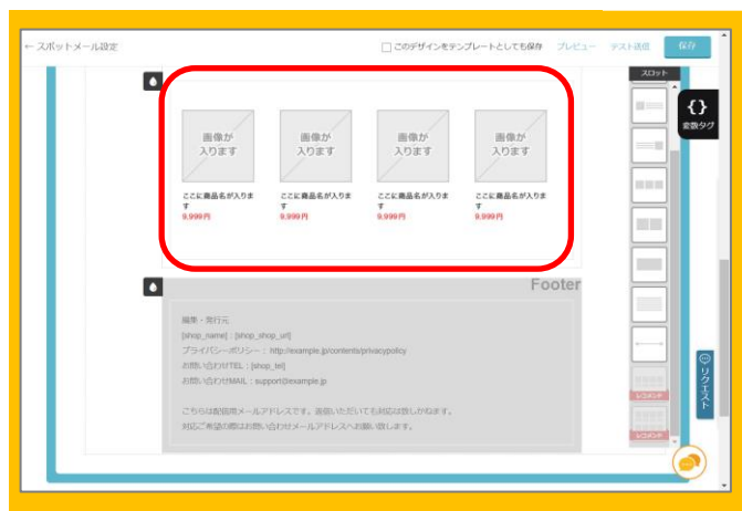
メール内にレコメンドスロットが挿入されます