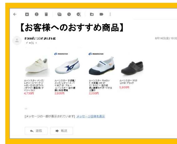
メール配信時、該当部分に各お客様に応じたレコメンド商品が挿入され、表示されます。