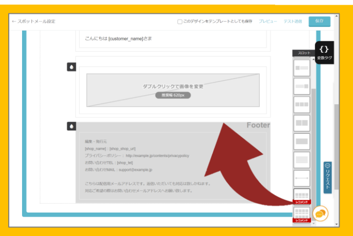
メール作成画面にて、レコメンドスロットをドラッグアンドドロップします